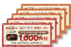
福袋限定クーポン