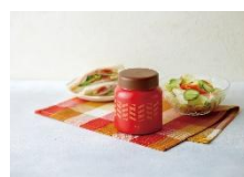
保温・保冷スープジャー