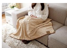
大判ブランケット