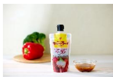
オリジナルベーコンドレッシング